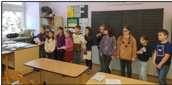
Vyučující 1. stupně