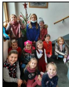
Vychovatelky školní družiny

Děti ze školní družiny přišly na Městský úřad ve Varnsdorfu a nazdobily jeden z pěti připravených vánočních stromků v květináči. Ozdoby si za pomoci vychovatelek samy vyrobily.